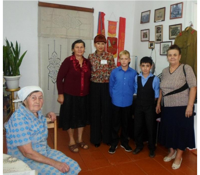
Встреча с детьми

Одной из интересных тем, для беседы является тема детства и юности всем известной актрисы Нонны Мордюковой, в нашем районе жила её бабушка. Пожилые люди с теплом отзываются об актрисе, некоторые помнят её маленькой озорной девчонкой.