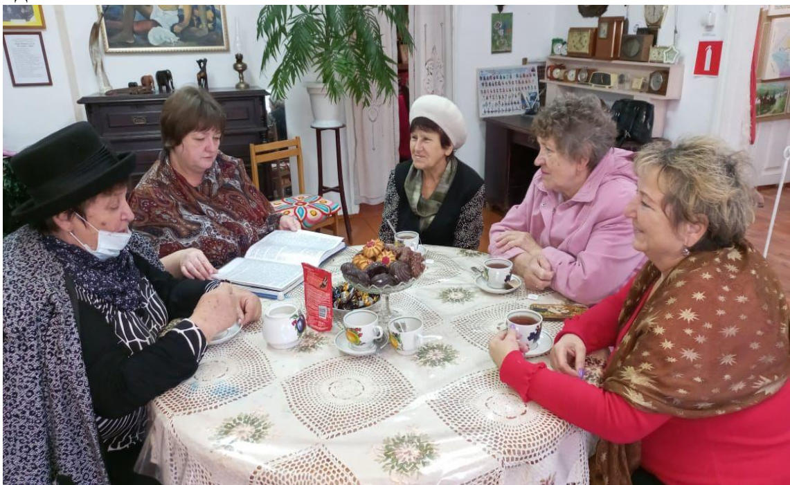
Дискуссии о знаменитых людях

Одной из интересных тем, для беседы является тема детства и юности всем известной актрисы Нонны Мордюковой, в нашем районе жила её бабушка. Пожилые люди с теплом отзываются об актрисе, некоторые помнят её маленькой озорной девчонкой.