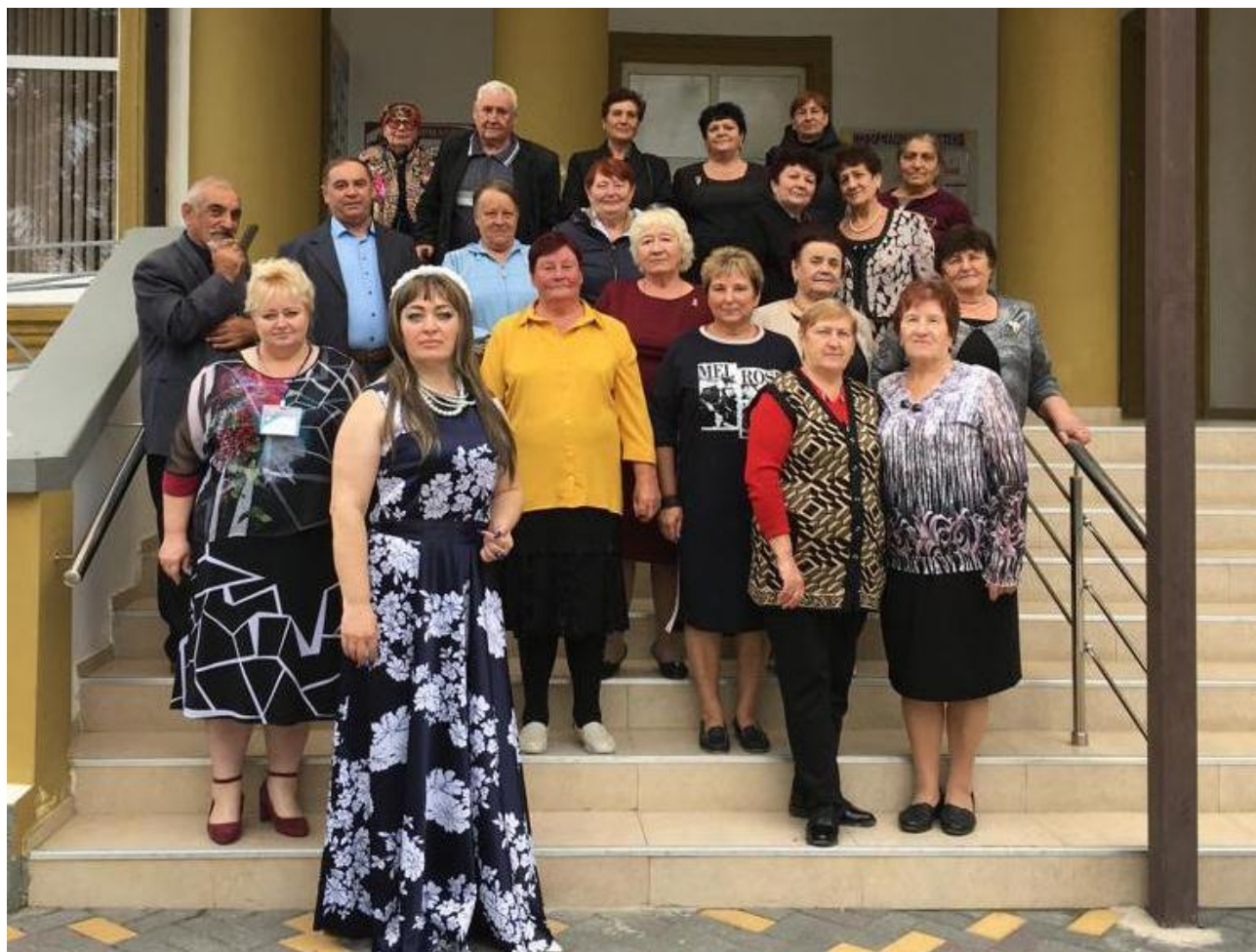
Встреча с художником