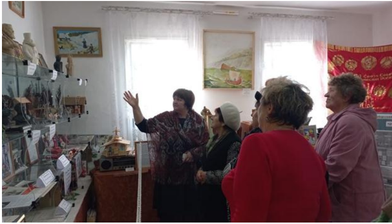
Экскурсия в музее